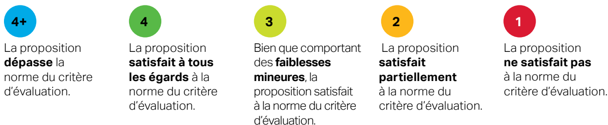
Tableau 1 – Énoncés relatifs à l'échelle d'évaluation