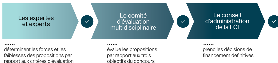
Figure 1 : Processus d'évaluation

Les propositions sont évaluées en deux étapes avant que le conseil d'administration de la FCI ne prenne les décisions de financement.