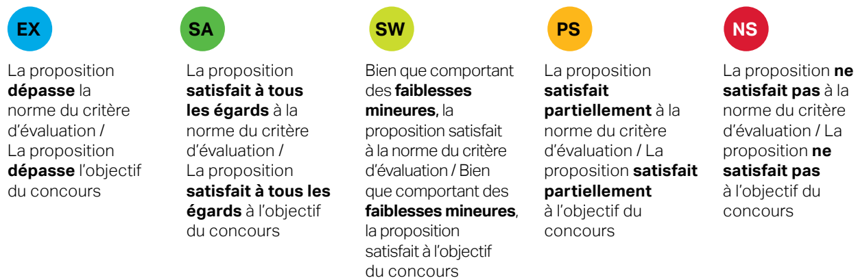
Figure 2 : Échelle d'évaluation de la FCI

Nous avons recours à une échelle d'évaluation comprenant cinq cotes permettant de déterminer dans quelle mesure une proposition répond à chaque critère d'évaluation ou objectif du concours.