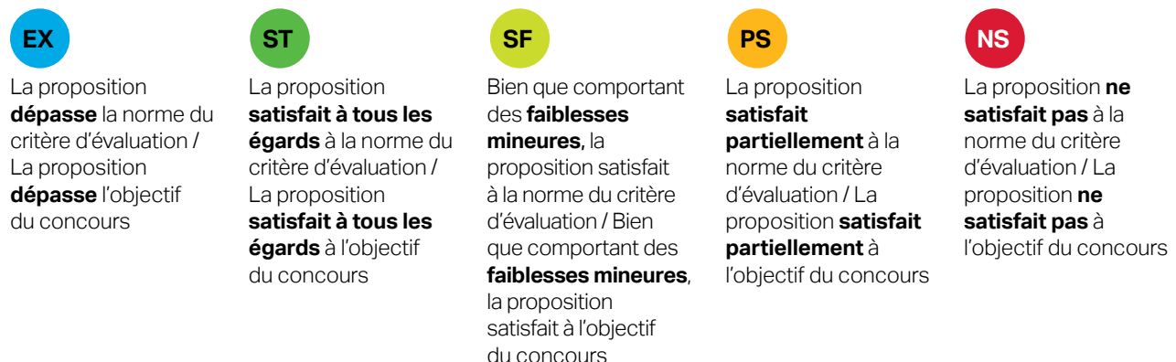
Figure 2 : Échelle d'évaluation de la FCI

Nous avons recours à une échelle d'évaluation comprenant cinq cotes permettant de déterminer dans quelle mesure une proposition répond à chaque critère d'évaluation ou objectif du concours.